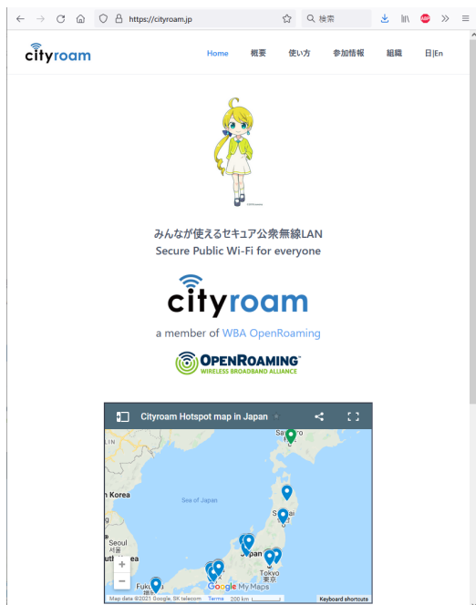
図1 Cityroam ウェブサイト (2021年9月).